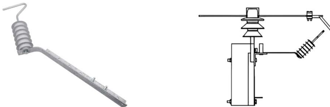
Рис. 1. Внешний вид устройств защиты от дуги APDO-1