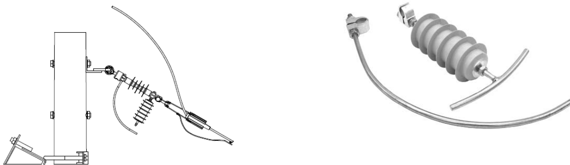
Рис. 1. Внешний вид устройств защиты от дуги APDO-2