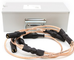
Рис.1. Устройство для закорачивания М6D

*Изготовитель оставляет за собой право вносить изменения в конструкцию и комплект поставки, не ухудшающие его характеристик.